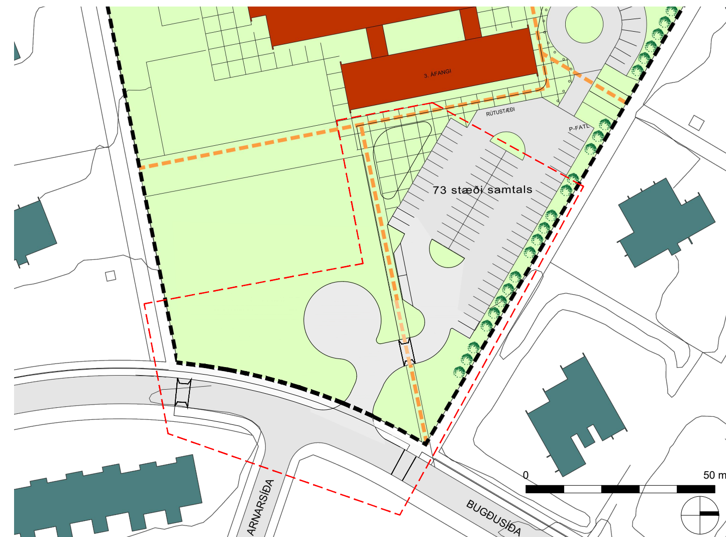
TILLAGA AÐ BREYTINGU Á DEILISKIPULAGI - 1:1.000

ÞESSI DEILISKIPULAGSBREYTING SEM AUGLÝST HEFUR VERIÐ SAMKVÆMT 43.GR. SKIPULAGSLAGA NR. 123/2010