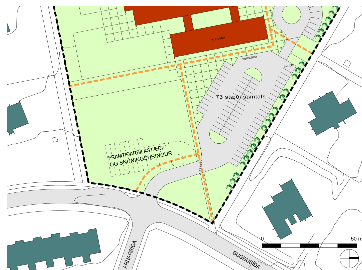
HLUTI ÚR SAMÞYKKTU DEILISKIPULAGI - 1:1.000

HÖNNUÐUR ÁSKILUR SÉR ALLAN RÉTT Á TEIKNINGUM - FJÖLFÖLDUN ER HÁÐ SKRIFLEGU SAMÞYKKI